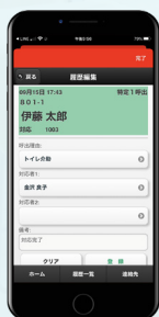
介護記録ソフト連携