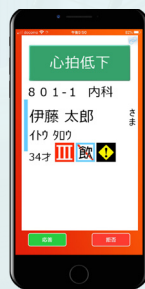
ベッドセンサー連携