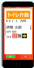
ナースコール 連携